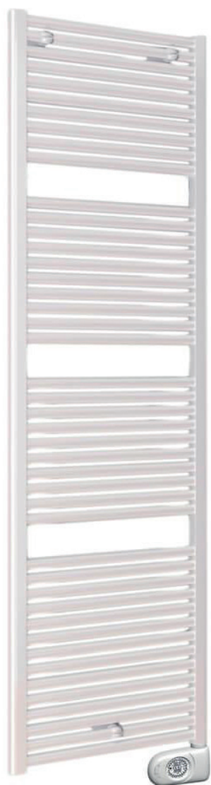
Handdoekradiator DRL E-Comfort Claudia 1807x600 mm 1200 Watt Wit