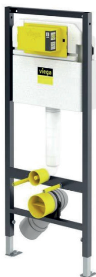
Inbouwreservoir Viega Prevista 1130