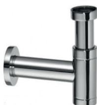
Sifon Raminex Designsifon met muurbuis Chroom