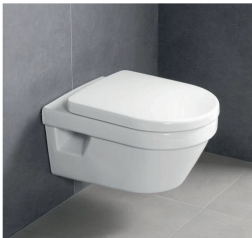
Wandcloset Villeroy & Boch Architectura DirectFlush inclusief SoftClose zitting en deksel Wit