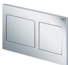
Bedieningspaneel Viega Visign for Style 21 Wit