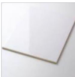
Wit glans RVV25956

Ca. 20 x 25 cm liggend in blokverband verwerkt, zilvergrijze voeg.