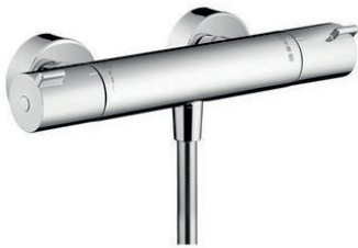
Douchethermostaat Hansgrohe Ecostat 1001 CL Chroom