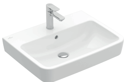
Wastafel Villeroy & Boch O.novo 600x460 mm (exclusief afgebeelde kraan) Wit