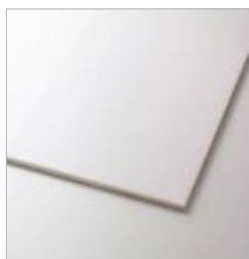
Wit mat RVV25957