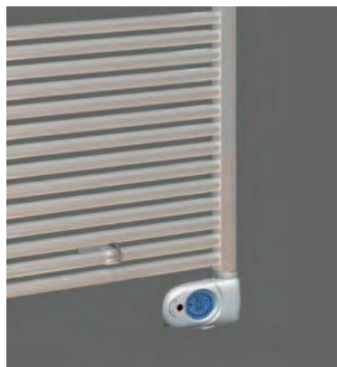
Elektrische digitale thermostaat DRL E-Comfort Claudia