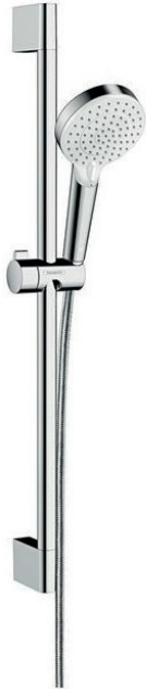
Doucheset Hansgrohe Crometta Vario met glijstang 65 cm Chroom